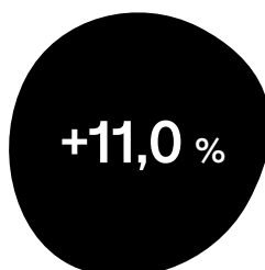
Förändring substansvärde per aktie Q/Q