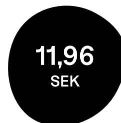
Substansvärde per aktie